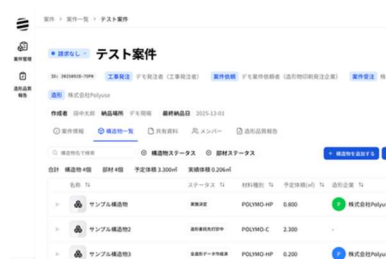
【ソフトウェア】 操作システム