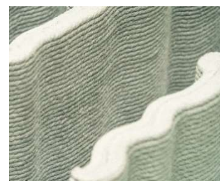
【マテリアル】 現場要件に応じた専用材料